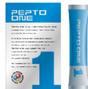
携帯用5g スティックタイプ 価格(税込):6,800円/5g×20包