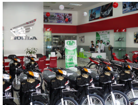
店内には HONDA ブランドのオートバイが並ぶ