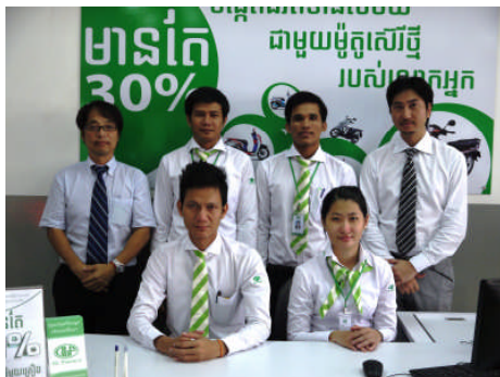
HONDA CHEA SAMBO (プノンペン)にて勤務する担当スタッフと本社立ち上げメンバー

今回の開設により GLF の営業拠点として 4 拠点目となりました。GLF はプノンペン市内の正規ディーラーで集中的に出店を行うことで、カンボジアでのオートバイファイナンスのパイオニア企業として、サービスの認知度を着実に向上させていく予定です。