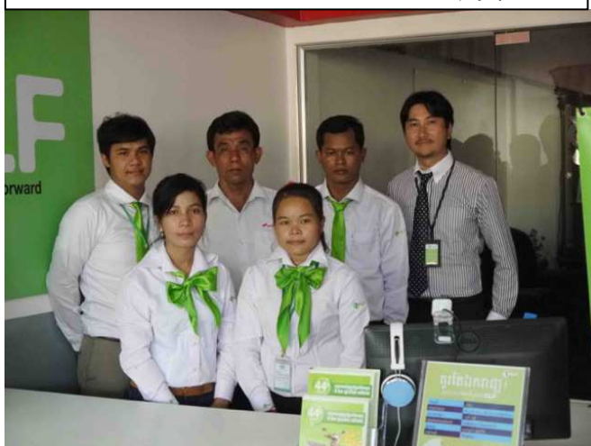
HONDA SOT BUNOEUN オーナーと GLF 社員