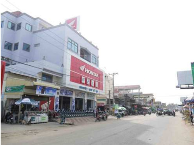
HONDA POR LENG のオーナーと GLF 社員