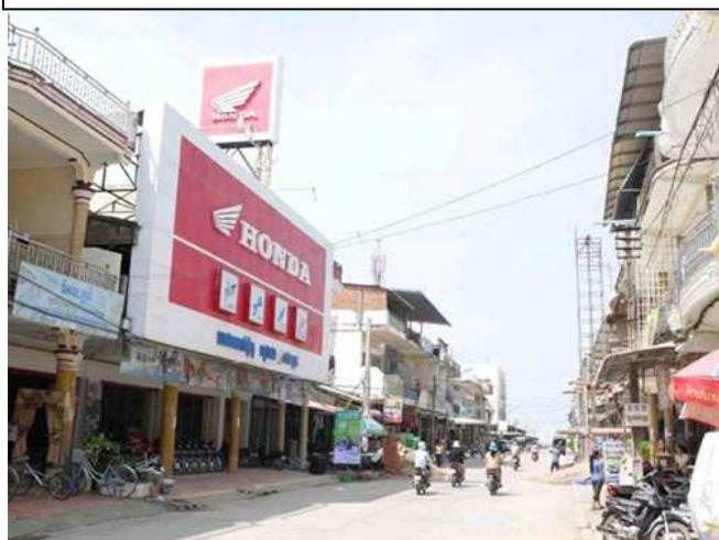
HONDA HENG OUN のオーナーと GLF 社員