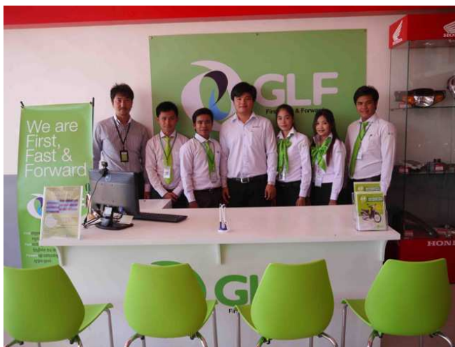
HONDA SEANGRANET のオーナーと GLF 社員