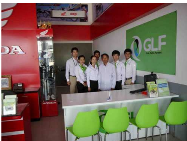
HONDA PREAH VIHEAR のオーナーと GLF 社員