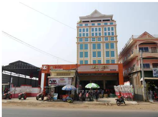
ENG HOK ディーラー店舗