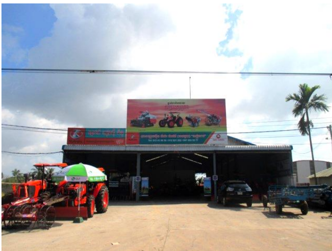
KUBOTA SEANGHY MARBO ディーラー店舗