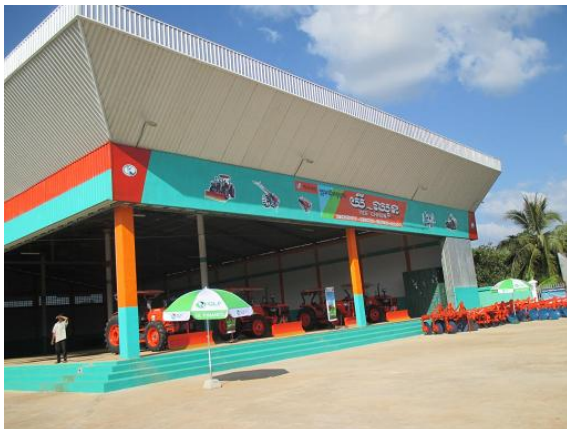
KUBOTA YEE CHUN