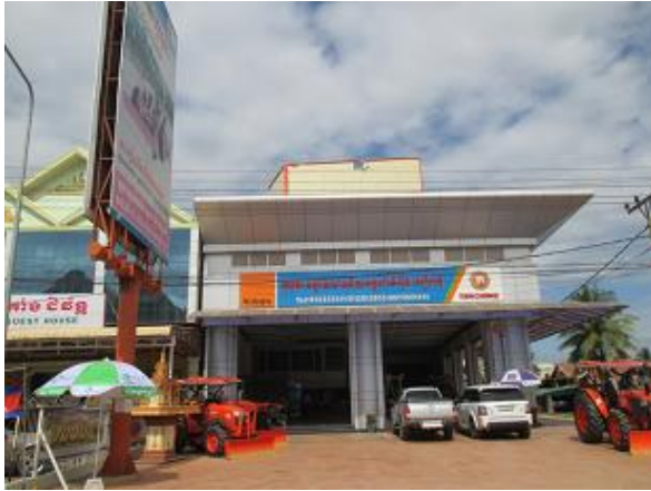
KUBOTA OENG SEANGHY