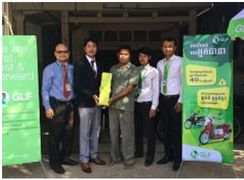
HONDA Un Bona