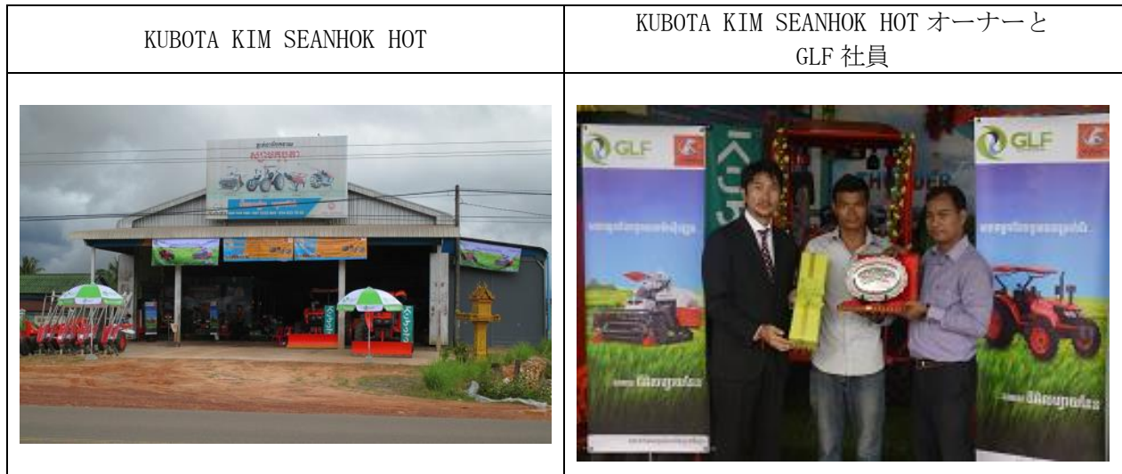
今回の KUBOTA KIM SEANHOK HOT 設置後の営業地域