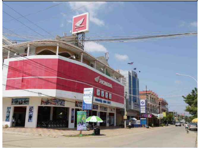
HONDA LIM HORNG ディーラー店舗