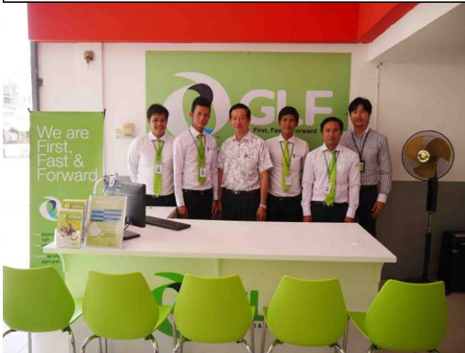
HONDA LIM HORNG のオーナーと GLF 社員