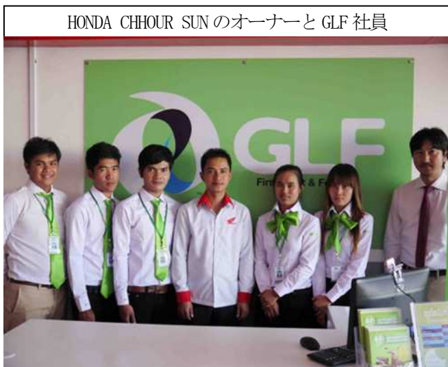
HONDA CHHOUR SUN のオーナーと GLF 社員