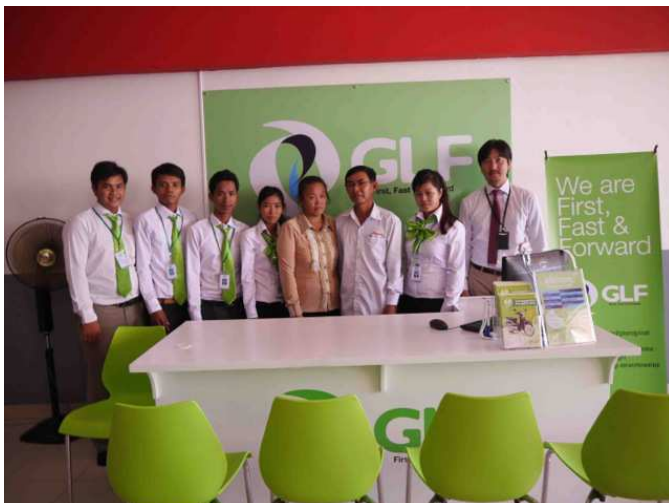
HONDA TY CHHENGHAK のオーナーと GLF 社員