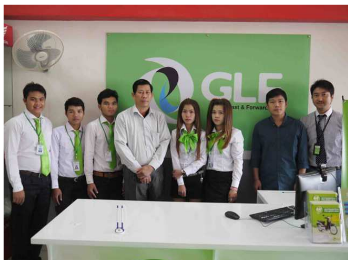
HONDA SENG HOUT ディーラー店舗